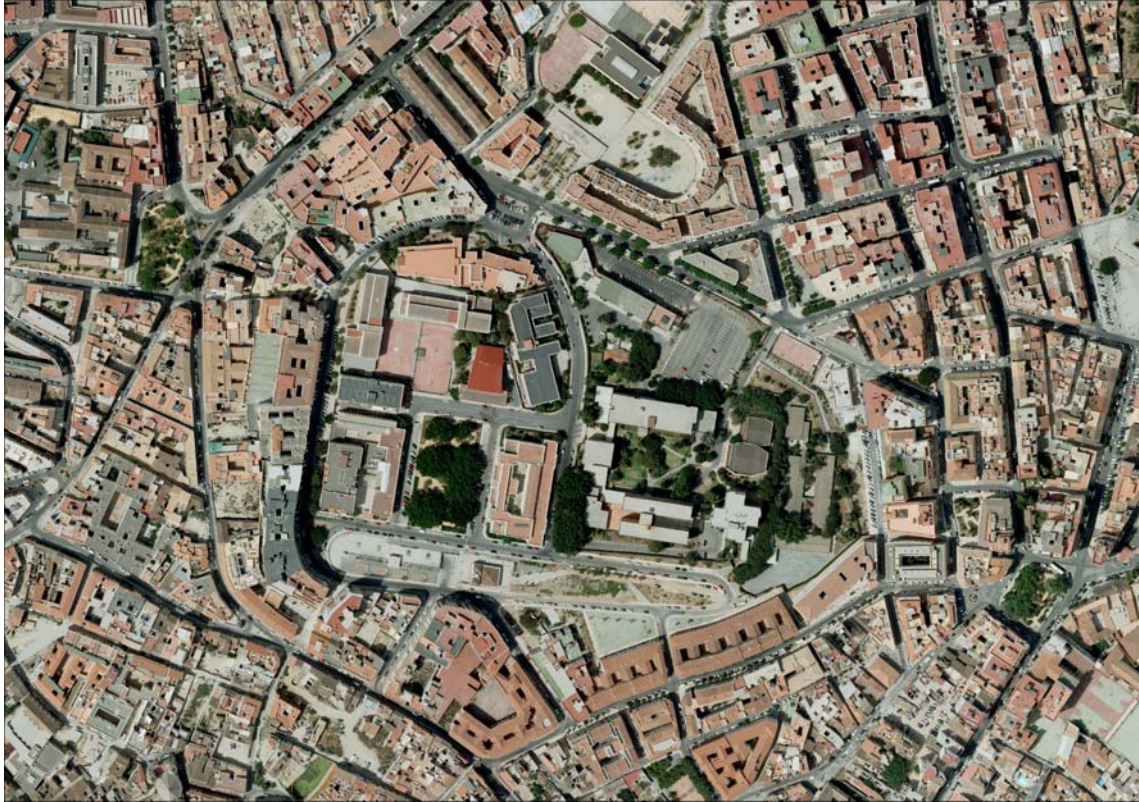
Panorámica del Campus de El Ejido